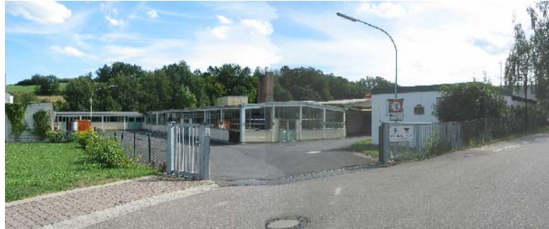
2. Hauptzufahrt Fa. Jean Höfler