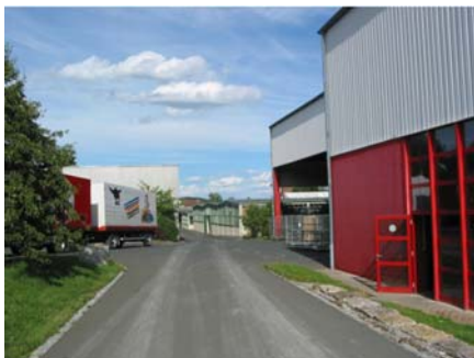
6. Blaserei und Spritzerei (rechts)