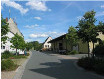
1. Nürnberger Straße